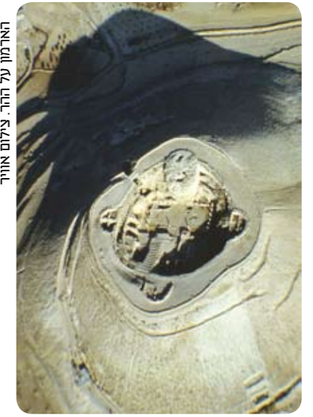
האדמדם על ההר.

שני בקומה הריבועית, ושלישי, קטן יותר, בקומה העגולה. בחדרים אלה הוצבו הסרקופגים (ארונות הקבורה) ששבריהם נתגלו במהלך החפירות. מבין שלושת הסרקופגים שנתגלו האחד אדמדם ומעוט - ככל הנראה ארונו של הורדוס - אשר נותץ במכוון ושבריו נמצאו פזורים בין חורבות המבנה. שני האחרים, בגוון לבן (האחד מהם מעוט), הופלו מתוך המאוזוליאום עוד בטרם פורק, והתרסקו על פני הקרקע, בצדו. שניהם נועדו, ככל הנראה, לבני משפחתו (אפשר כי אחד מהם היה שייך לאשתו החמישית, מלתקי, אמו של ארכילאוס).