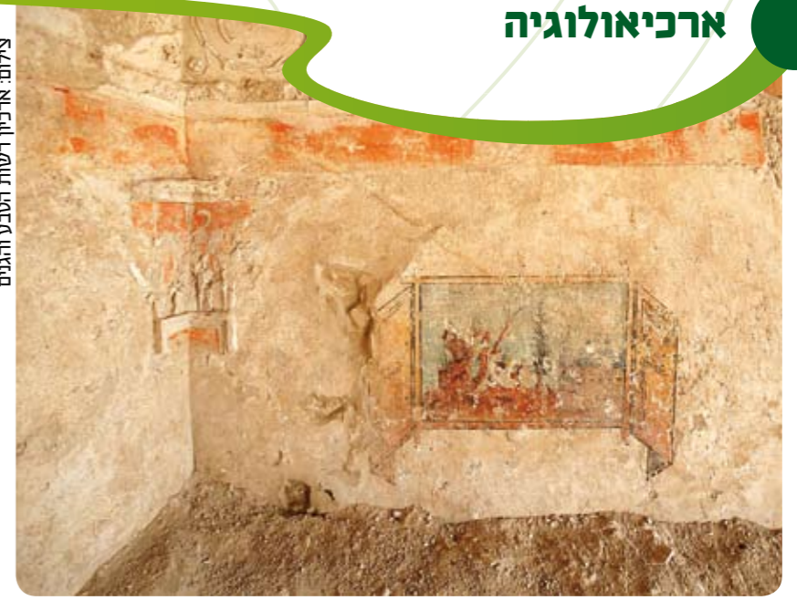
קירות החדר הגדול בתיאטרון.