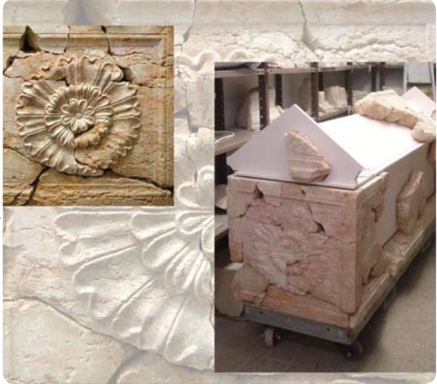
ארונו של הורדוס. מעוט ואדמדם.

יותר מ־70 אלף מבקרים לאחרונה החל מאמץ, על ידי הרשויות הנוגעות בדבר, לשדרג מבחינה תיירותית את חלקו העליון של האתר, ארמון מבצר ההר ומורדותיו. השרידים המרשימים על ראש ההר, שמרביתם נחשפו עוד לפני 40-45 שנה, מחייבים עבודות שימור וחזוק רבות. יש לקוות כי גם חלקו השני של האתר הנרחב - הרודיון התחתית - יחזור למעגל הפיתוח כגן לאומי (כמו גם המחקר), פעילות שהחלה בתנופה בשנות ה־80 אך נפסקה בעקבות אירועי האינתיפאדה. באותן שנים עלה מספר המבקרים באתר, מדי שנה, על 200,000 (כיום כ־70,000) ואין כל סיבה שהמספר בעתיד לא יגדל עוד בהרבה.