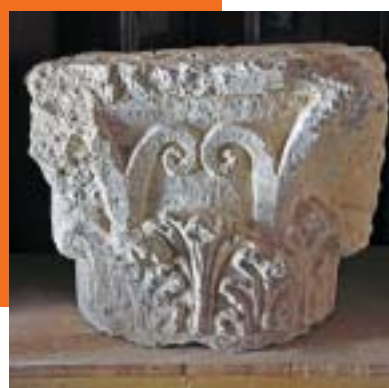
כותרת קורינתית ממבנה התיאטרון מימין: ציור בפרסקו דמוי שיש על טיח באחת מחוליות העמודים שנמצא בתיאטרון