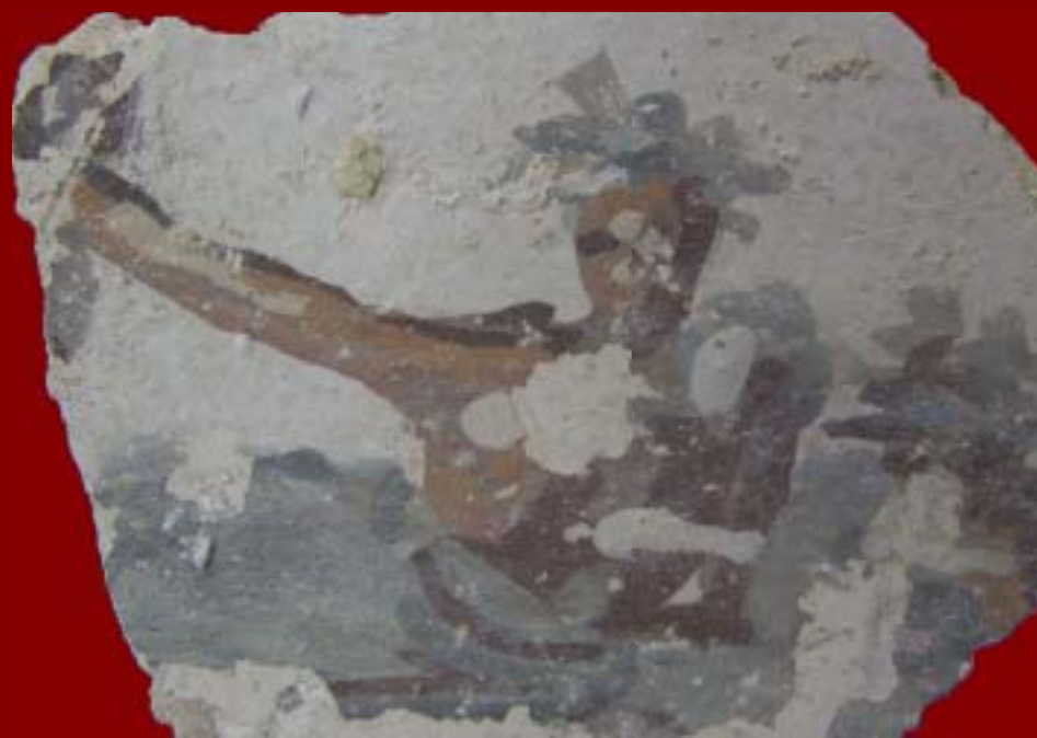
אדם לבוש טוגה ועל ראשו זר עלי דפנה, השויך כנראה לאחד מציורי החלונות. נמצא בין החורבות