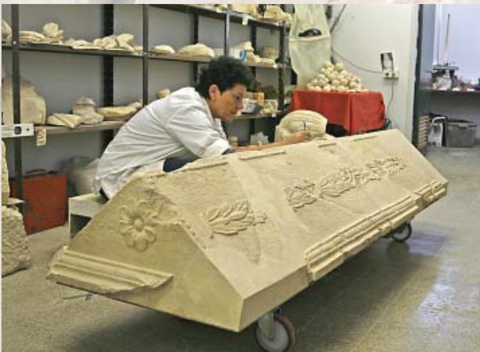
מכסה הסרקופג הלבן בעת עבודות השחזור

סביר להניח כי הנקברים האחרים במאוזוליאום היו בני משפחתו של הורדוס, ואפשר, כפי שכבר צוין לעיל, כי הם נקברו בעשר השנים שבהן ארכילאוס שלט ביהודה, בטרם נשלח לגלות בשנת 6 לסה"נ, בידי הרומאים שישבו לאחר מכן בהרודיון. אפשר שהארון המפואר הלבן שייך למלתאקי 'השומרונית', אשתו החמישית של הורדוס, ואמו של ארכילאוס, שמתה ברומא מספר חודשים לאחר מות בעלה, וגופתה הוחזרה כנראה ליהודה והונחה לצד הורדוס. מועמדת נוספת היא גלפירה, אשתו השנייה של ארכילאוס, שמתה מאוחר יותר. כך או אחרת במאוזוליאום נקברו לכל הפחות עוד שניים מבני משפחת הורדוס, וקיים יסוד להניח כי היו גם נקברים נוספים, גם אם לא הוטמנו בארונות אבן. יש להניח, עם זאת, לאור התמונה הכוללת, כי הורדוס היה ראשון הנקברים במונומנט המפואר שבנה.