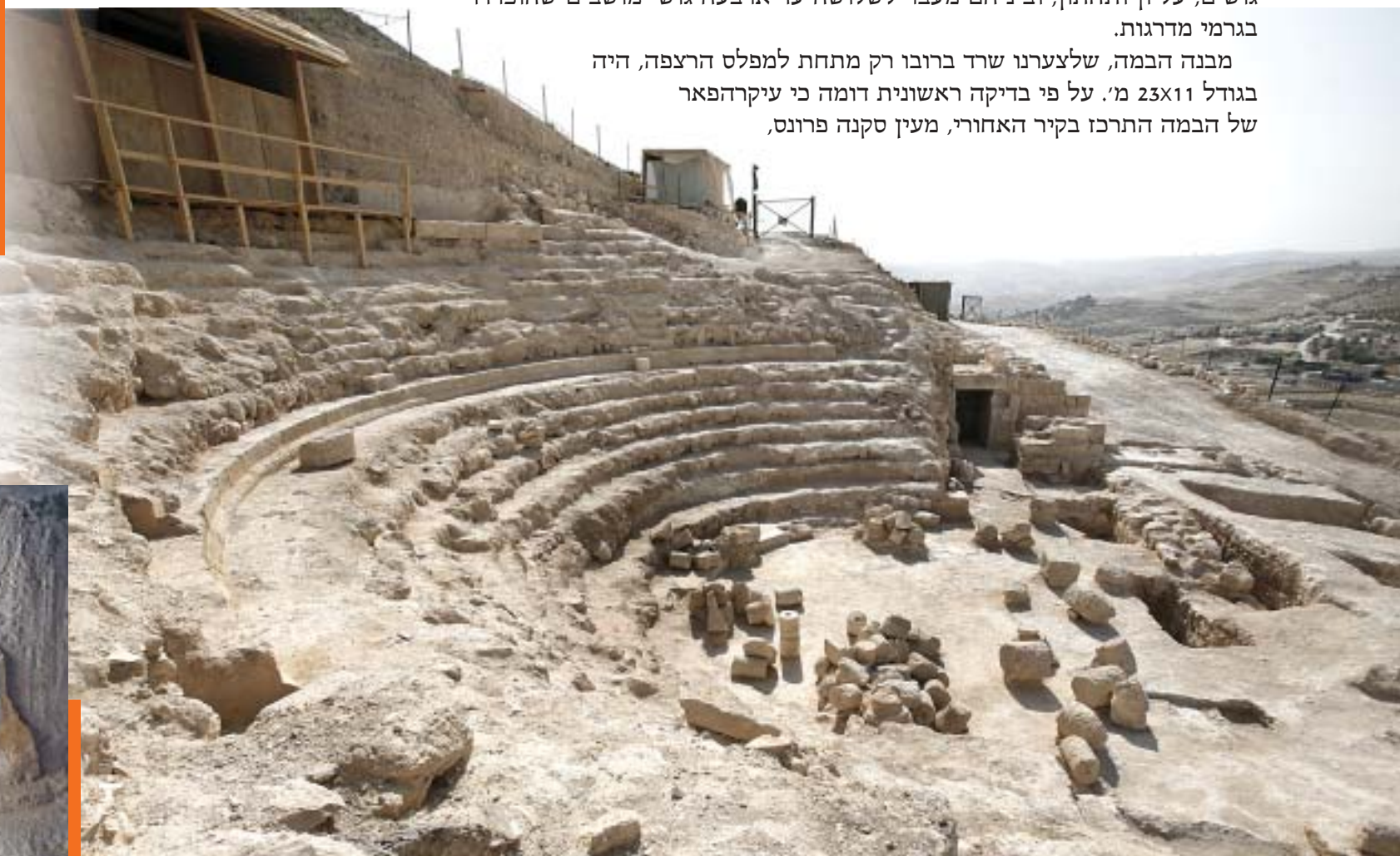
התיאטרון בהרודיון; מבט ממזרח