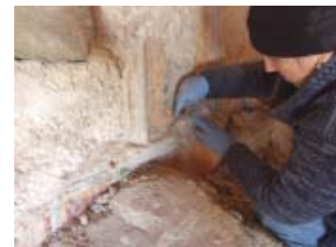
במהלך החפירה משמאל: תנור אפיה וקירות דלים שבנו הפועלים בתא המלכותי, בעת מפעל הקמת ההר המלאכותי וכיסוי התיאטרון