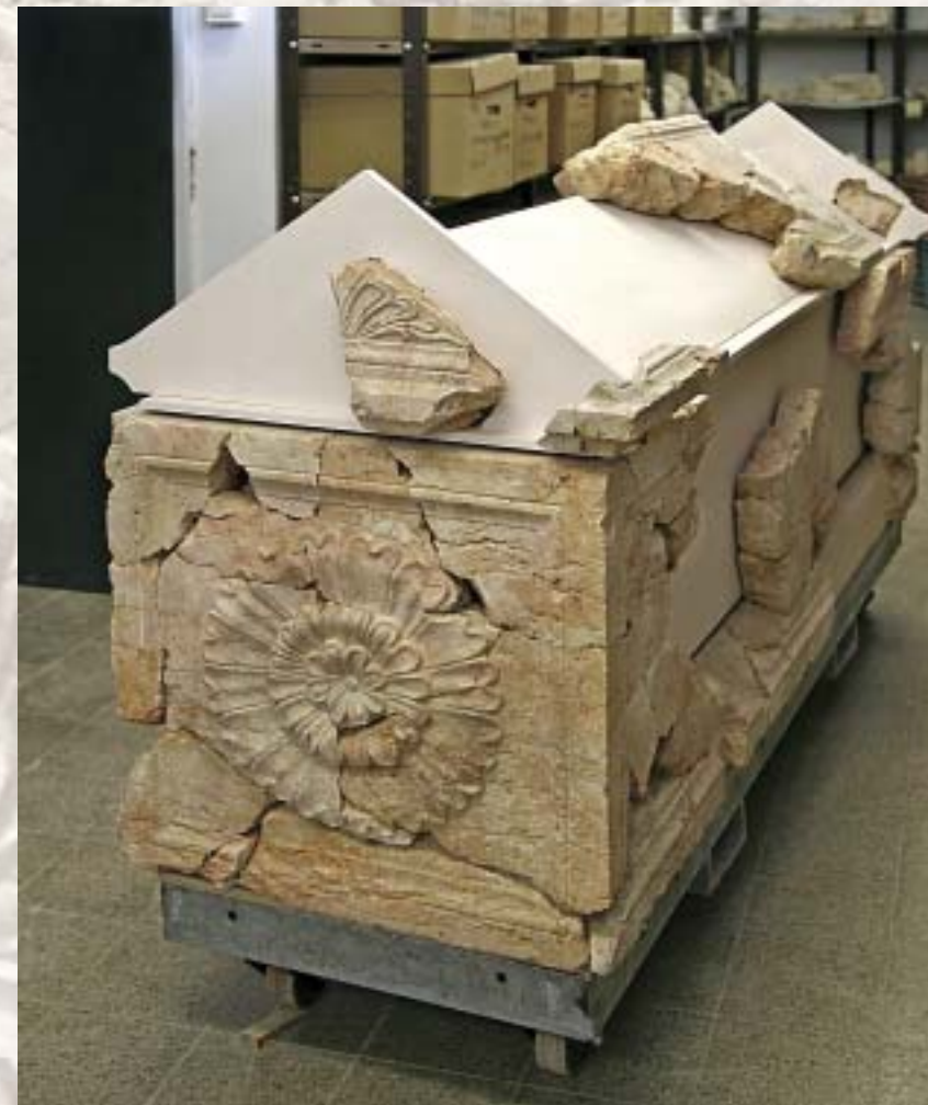
הסרקופג מאבן גיר אדמדמה המיוחס להורדוס, בעת שחזורו

המאוזוליאום ניצב במקומו במשך 70 שנה, כשהוא מוקף ומובלט על ידי ההר המלאכותי, אשר נבנה כמצבת ענק מעט לפני מותו של הורדוס. המצב השתנה בשנת 66 לסה"נ, לאחר שהרודיון נכבשה בידי המורדים היהודים מידי חיל המצב הרומי שהחזיק בו. הם הרסו וניתצו ביסודיות את המאוזוליאום והסרקופגים, מתוך זעם שהיה אצור וודאי בקרב תושבי יהודה במשך דורות ובא על פורקנו באחת. עדות מסייעת לכך הם המטבעות הרבים מימי המרד שנמצאו בין המפולות של המאוזוליאום, וכן תנורי בישול ואשפה המעידים, כי לאחר ההרס, המשיכו המורדים להתגורר כאן, במקביל לפעילותם במבצר שעל ההר.