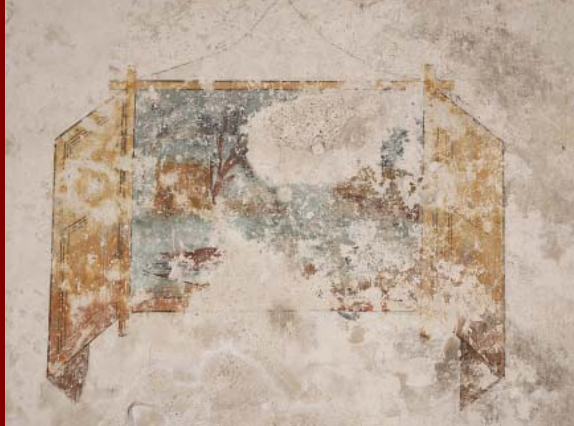
מראה גוף נילוטי הניבט מתוך חלון. למטה משמאל, דמות של תנין