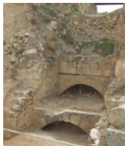
קשתות וקירות תמך של המדרגות המונומנטליות

של סטוקו וצבע, שנשאו כותרות קורינתיות. חלקם התחתון של הקירות עוטר בספינים (פנלים) מלבניים בצבעי כתום ובורדו, וניתן אף לראות כי נעשו בהם שינויים המהלך תקופת קיומו הקצרה של החדר.