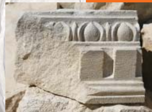
מימין: המאוזוליאום המשוחזר משמאל: אחת מחמש האורנות שעטרו את המאוזוליאום (למעלה); שריד עיטור מהאנטבלטורה (למטה)