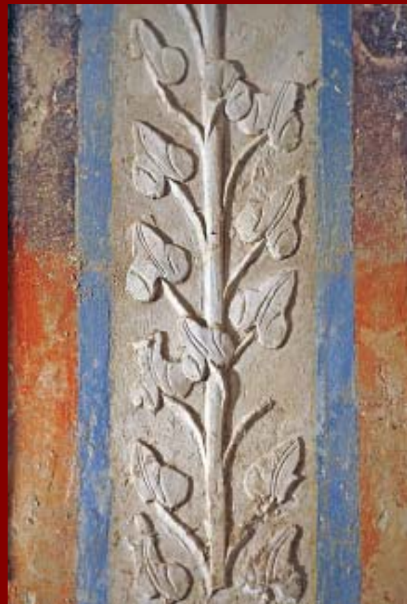
אומנה (דמוי עמוד) מעוצבת בשילוב של צבע וסטוקו ומעוטרת בעלי קיסוס משמאל: עיטור שממנו צומח עלה הקיסוס