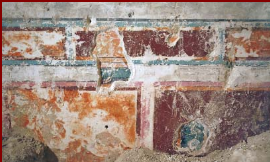
פגלים בצבעי כתום ובורדו בחלק התחתון של קירות התא המלכותי