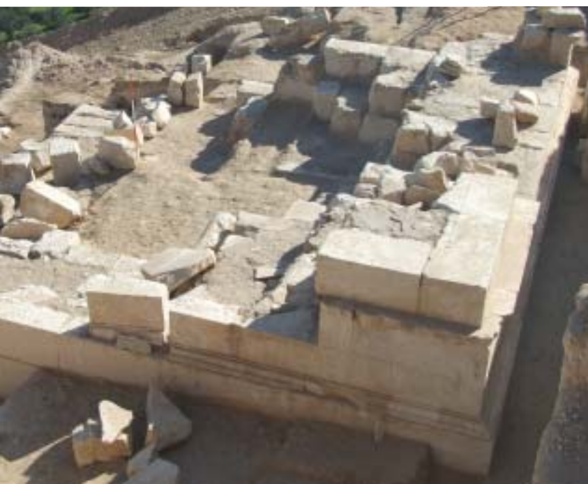
המסד (הפודיום) ושרידי המאוזוליאום למעלה: פריטים אדריכליים שנחשפו בחפירות. מימין, שרידי מסד המבנה שנשתמר בשטח

* החפירות נערכות מטעם המכון לארכאולוגיה באוניברסיטה העברית וממומנות ברובן מכספי תרומות. כיום ממשיך מחקר האתר כחלק מפיתוח תשתית תיירותית ועבודות שימור נרחבות, בסיוע החברה הממשלתית לפיתוח התיירות, המועצה האזורית גוש עציון ורשות הטבע והגנים.