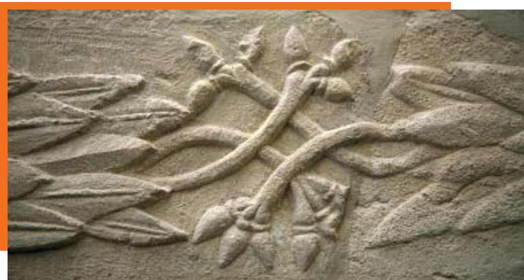
שרידים מהטרקופג הלבן: עלים ופרי של דפנה שעטרו את המכסה (למעלה) פרחים ועלים של קיסוס בדפנות הארון (למטה)

לא נמצאה כל עדות לגרם מדרגות שהוביל אל הקומות העליונות של המאוזוליאום. סביר על כן, להניח, כי מדרגות או גשרים זמניים הוקמו לפני כל לוויה. בשטח שהקיף את המונומנט הוכשר גן מדורג בטרסות, שנועדו לאדמת הגן, והצמחייה שבו נהנתה מבכרת השקיה מיוחדת, שנבנתה ממערב למאוזוליאום. הורדוס לא נקבר לבדו במאוזוליאום, אם כי סביר להניח שהיה ראשון הנקברים, ואליו צורפו, ככל הנראה בימי שלטון בנו ארכילאוס, נפטרים נוספים. פרט לטרקופג מאבן גיר אדמדמה שהתגלה תחילה, נמצאו בהמשך החפירות שברים