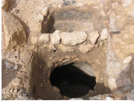
איור 6 - המקווה המזרחי: בריכות המים ומיכל המים שתחתן בשלב השני לקיום המקווה

הטבילה שלו גדולה יותר: ממדיה כ- 2.3x4 מ', עומקה המירבי 2 מ' ונפחה כ- 9 מ"ק. גם במקווה זה נבנתה בריכת מים קטנה ותחתיה מיכל מים פעמוני, שניהם בממדים דומים לאלו של המקווה המערבי, אלא שבשונה ממנו מיכל המים נבנה צמוד לקיר המערבי של בריכת הטבילה ונקב חיבר אותו עם בריכת הטבילה (איור 5). בשלב הראשון היו ממדי הבריכה העליונה 0.6x1.25 מ' וכ- 0.5 מ' גובהה, ונפחה היה מעל 1/3 מ"ק. בשלב השני, שהוא הנראה היום (איורים 6, 7), חולקה הבריכה לשניים וחלקה הצפוני שימש כבריכת ניקוז, שממנה הוזרמו המים באמצעות צינור אל המיכל התחתון, אשר בשונה מהמקווה המערבי המשיך לתפקד גם בשלב זה. בהמשך הדברים נדון רק בשלב הראשון של המקווה.