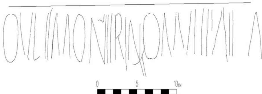
1 החרותת הלטינית מהרודיון (שרטוט: ר' צ'אצ'י)