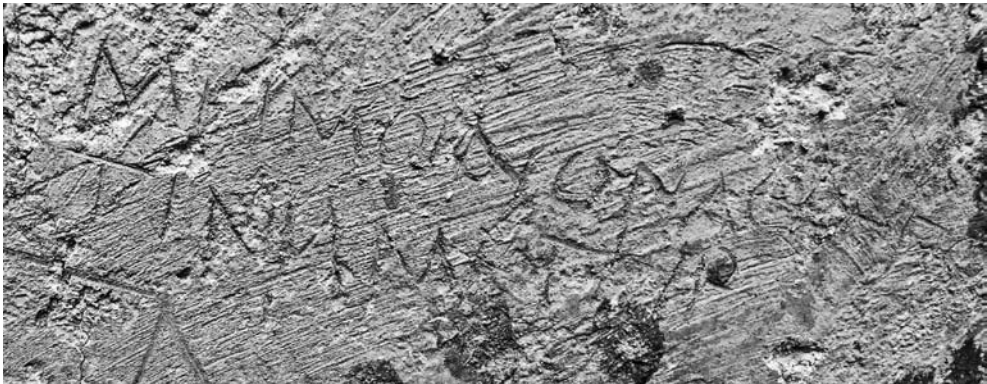
3 תקריב של הגרפיטו ההומרי מהרודיון