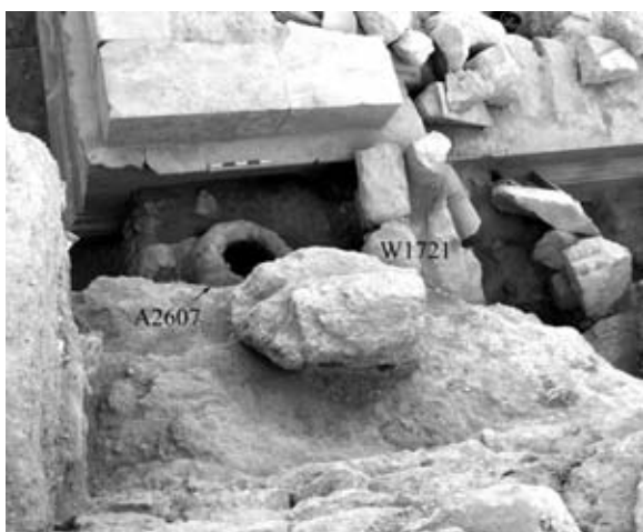
איור 6: שרידי קירות וטבון שתוארכו לימי מרד החורבן, בתוך שכבת המפולות של מבנה המאוזולאון

הממצא הנומיסמטי מ"מתחם הקבר" כולל מטבעות מהשנים ב'-ד' למרד הראשון, 67-70 לספירה (אחיפז בדפוס). מטבעות אלו נמצאו בתוך שכבת מפולות ברורה ומוגדרת של מבנה המאוזולאון, וכן מתחיתה ומעליה, דבר המלמד כי חורבנו התרחש במהלך מרד זה (איור 6). ועוד זאת: מציאותם של מטבעות מהשנים ג' ו-ד' למרד (68/69 – 69/70 לספירה) בתוך שכבת המפולות וכן בבסיסה מלמדת על אפשרות שפעולת ההרס העיקרית לא נעשתה בראשיתו של המרד אלא דווקא לקראת סופו (פורת, קלמן וצ'אצ'י בדפוס), בפרק הזמן ששמעון בר גיורא פעל באזור.