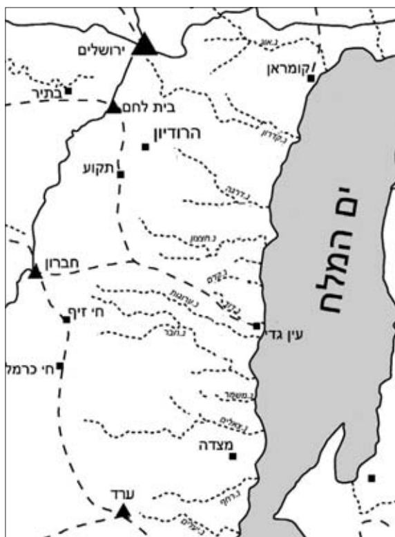
איור 5: מפת מרחב הפעילות של שמעון בר גיורא במזרח של אידומיאה

ברצוננו להציע, אם כן, כי הרס מבנה המאוזולאון נעשה דווקא בידי אנשי בר גיורא, ולא בידי "האדומים", שליטי המקום בעת הזו. מעבר להתאמה בזמן ובמקום ברצף