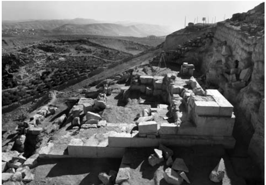
איור 4: שרידי הפודיום באתרו