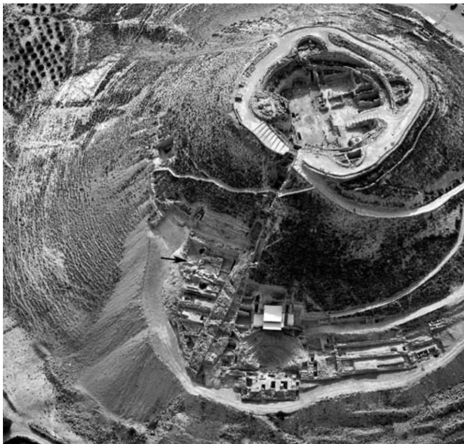
איור 1: שרידי המאוזולאון שזוהה עם קברו של הורדוס (מסומן בחץ) בתוך "מתחם הקבר" שבמדרון הצפוני-מזרחי של הר הרודיון.

מתיאוריו של יוסף בן מתתיהו עולה כי בראשית המרד השתלטו יהודים ממוצא אדומי ("אדומים" בכתבי יוסף) על ארמון-מבצר ההר בהרודיון והחזיקו בו במהלך המרד. עם זה, מהנתונים הסטרטיגרפיים והנומיסמטיים שנמצאו ב"מתחם הקבר" עולה כי ההרס המכוון של המאוזולאון נעשה רק לקראת סופו של המרד (בשנת 69 לספירה בקירוב) – בפרק הזמן שפעלה באזור סיעתו של שמעון בר גיורא, שהותירה בו הרס רב.